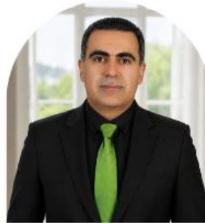
امیرحسین سیاه پوش نائب رئیس دوم